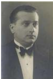
France Marolt (1891–1951) ravnatelj Folklornega inštituta med letoma 1934 in 1951