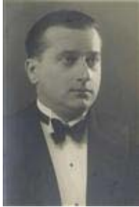
France Marolt (1891–1951) ravnatelj Folklornega inštituta med letoma 1934 in 1951